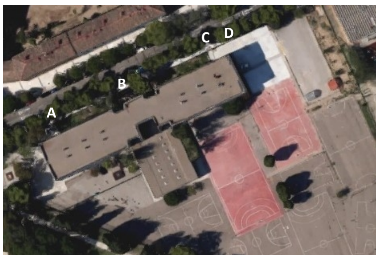
Foto 1. Puertas de acceso al centro

Se dispone de cuatro entradas desde la calle al centro: Puerta A, puerta B, puerta C y puerta D.